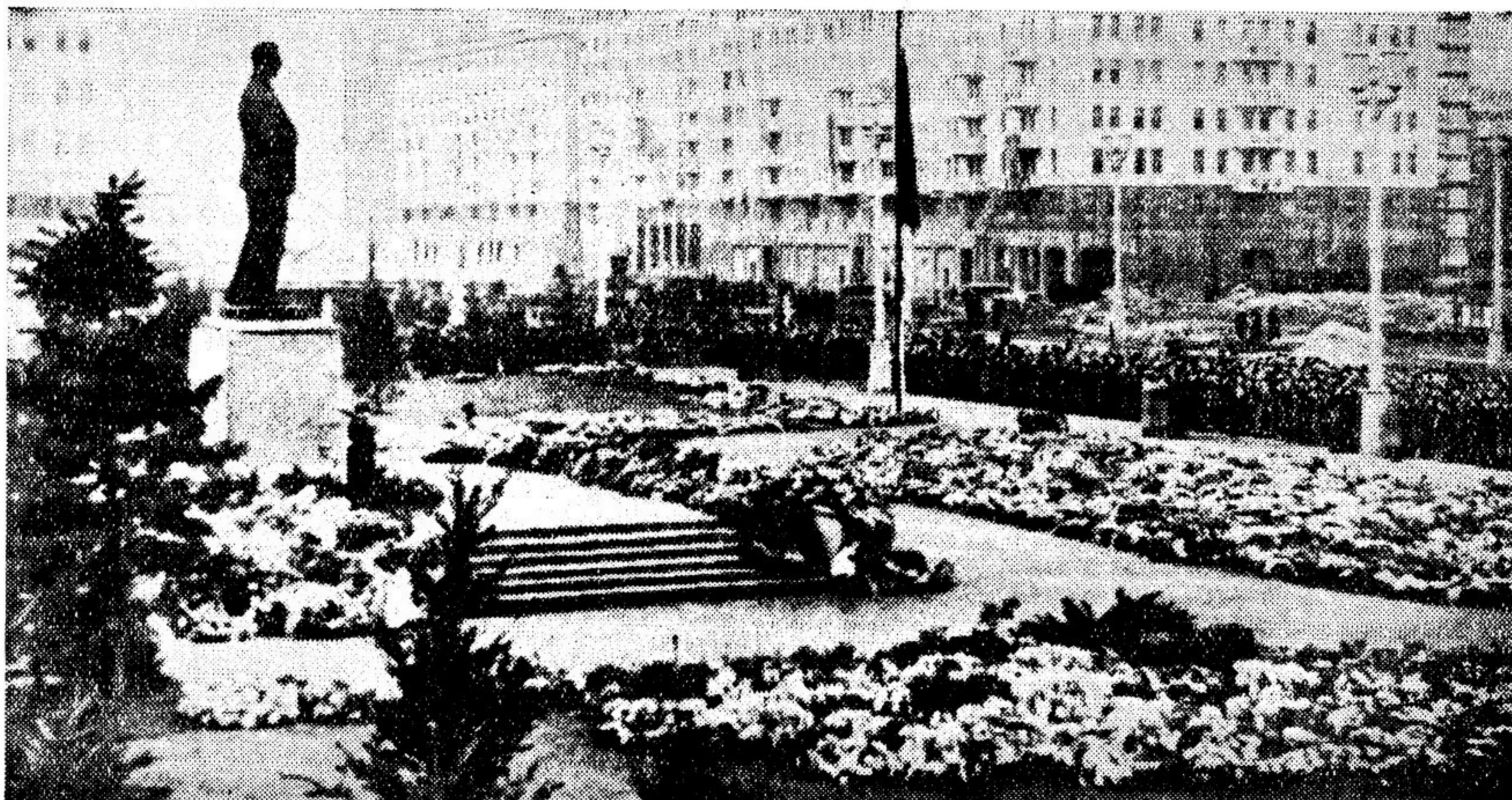
В Берлине на Аллее Сталина состоялось траурное шествие. Трудящиеся германской столицы возложили многочисленные венки к подножию монумента И. В. Сталина

шего самого ценного блага — мира. Мы, жители Гавра, вновь решительно повторяем торжественную клятву: «Народ Франции не будет, никогда не будет встать против Советского Союза».